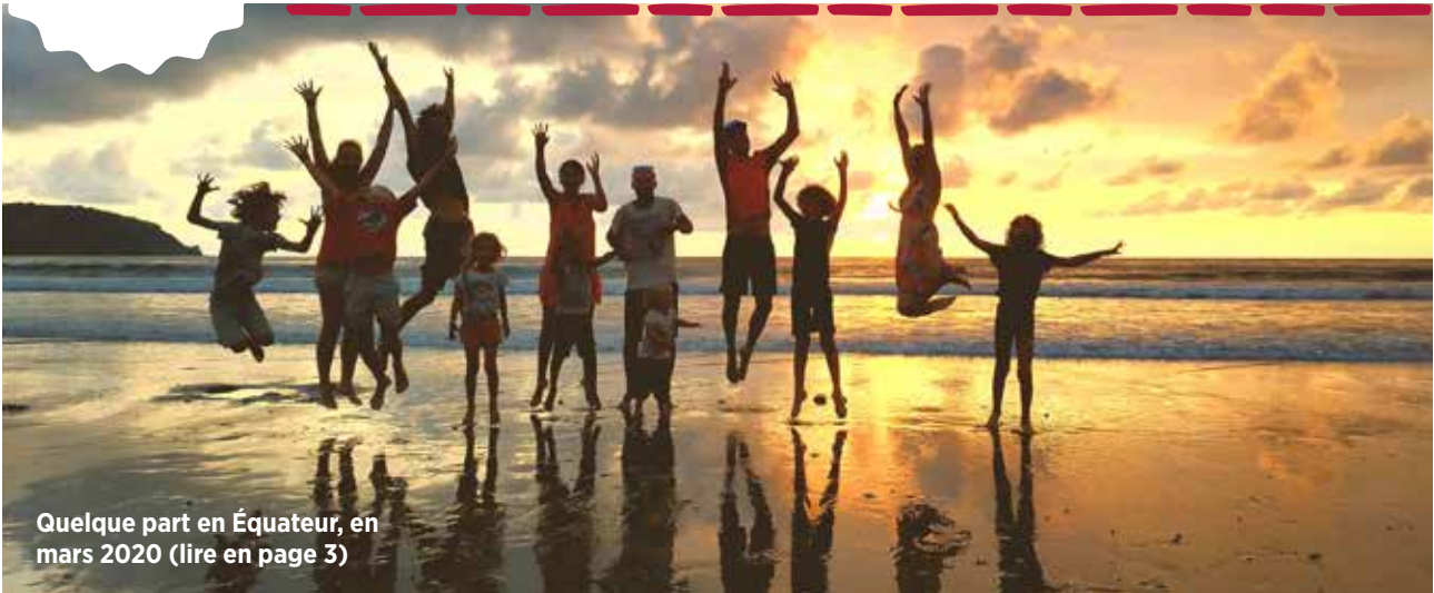
Quelque part en Équateur, en mars 2020 (lire en page 3)