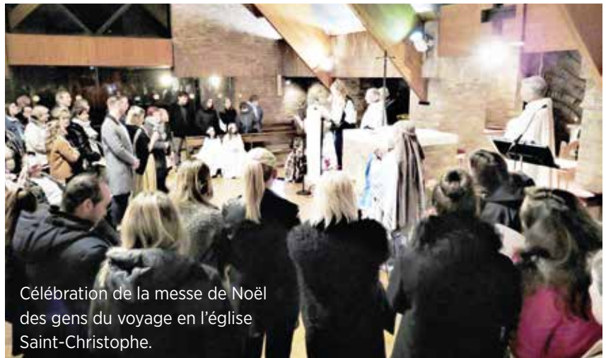
Célébration de la messe de Noël des gens du voyage en l'église Saint-Christophe.