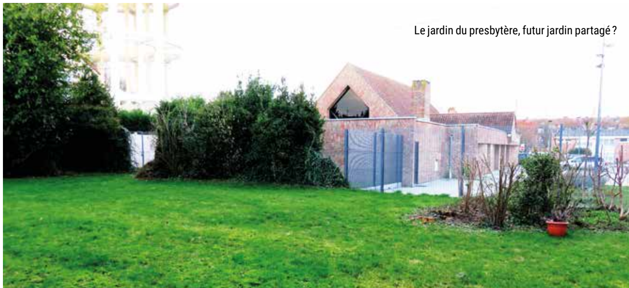
Le jardin du presbytère, futur jardin partagé?

«ÉGLISE VERTE, C'EST UNE DÉMARCHE QUI S'ADRESSE AUX COMMUNAUTÉS CHRÉTIENNES QUI VEULENT S'ENGAGER POUR LE SOIN DE LA CRÉATION» 1 . LE LABEL EGLISE VERTE EST UN OUTIL D'AIDE AUX COMMUNAUTÉS POUR METTRE EN PRATIQUE LEUR ENGAGEMENT.